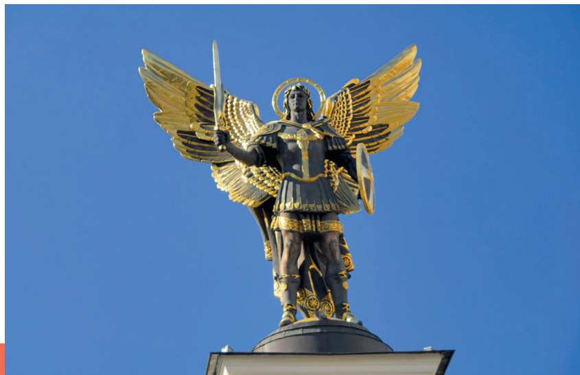
Ärkeängeln S:t Mikael, Maydan nezalejnosti; Kiew/Ukraine

Helige Mikael, ärkeängel, försvara oss i drabbningen, var vårt värn emot djävulens skurkstreck och snaror. Må Gud befalla över honom, bönfaller vi ödmjukt; och du, de himmelska härskarornas furste, fördriv i Guds kraft till helvetet, satan och alla andra onda andar, vilka till själarnas fördärv stryka omkring överallt i världen. Amen.