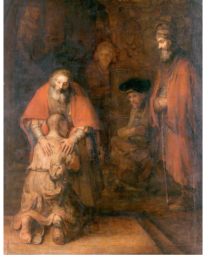
Den förlorade sonens återkomst, 1669, Rembrandt van Rijn, Eremitaget, Sankt Petersburg

Kan en sådan förnyelse verkligen inträffa? Själur som förhärdats i synd tycks förbli slutna. Själviskhet och