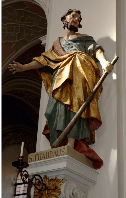
Basilika St. Vitus (Ellwangen, Tyskland)

S:t Judas Taddeus uppfattas som skyddspatron för hopplösa fall, eftersom han i sitt brev uppmanar sina läsare: "Men ni, mina kära, skall bygga ert liv på er allraheligaste tro under bön i helig Ande. Håll er kvar i Guds kärlek och se fram emot att vår Herre Jesus Kristus skall förbarma sig och ge er evigt liv" (verserna 20-21). Aposteln uppmanar till bön i den helige