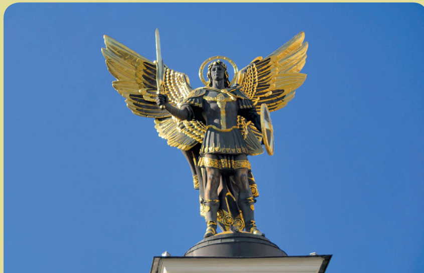
Ärkeängeln S:t Mikael, Maydan nezalejnosti; Kiew/Ukraine

Helige Mikael, ärkeängel, försvara oss i drabbningen, var vårt värn emot djävulens skurkstreck och snaror. Må Gud befalla över honom, bönfaller vi ödmjukt; och du, de himmelska härskarornas furste, fördriv i Guds kraft till helvetet, satan och alla andra onda andar, vilka till själarnas fördärv stryka omkring överallt i världen. Amen.