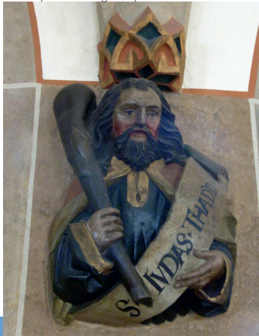
Stadskyrkan Balingen, Tyskland

Kyrkohistorikern Eusebius berättar (i sin Kyrkohistoria , I 13) att kung Abgar i Edessa i landet Osroene (i Mesopotamien) blivit svårt sjuk i spetälska. Eftersom kungen hört talas om Jesu underverk, sände han bud till denne och bad om hjälp. Jesus lovade att han skulle sända en av sina lärjungar att bota hans sjukdom. Efter Jesu himmelfärd