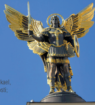
Ärkeängeln S:t Mikael, Maydan nezalejnosti; Kiew/Ukraine

Helige Mikael, ärkeängel, försvara oss i drabbningen, var vårt värn emot djävulens skurkstreck och snaror. Må Gud befalla över honom, bönfaller vi ödmjukt; och du, de himmelska härskarornas furste, fördriv i Guds kraft till helvetet, satan och alla andra onda andar, vilka till själarnas fördärv stryka omkring överallt i världen. Amen.