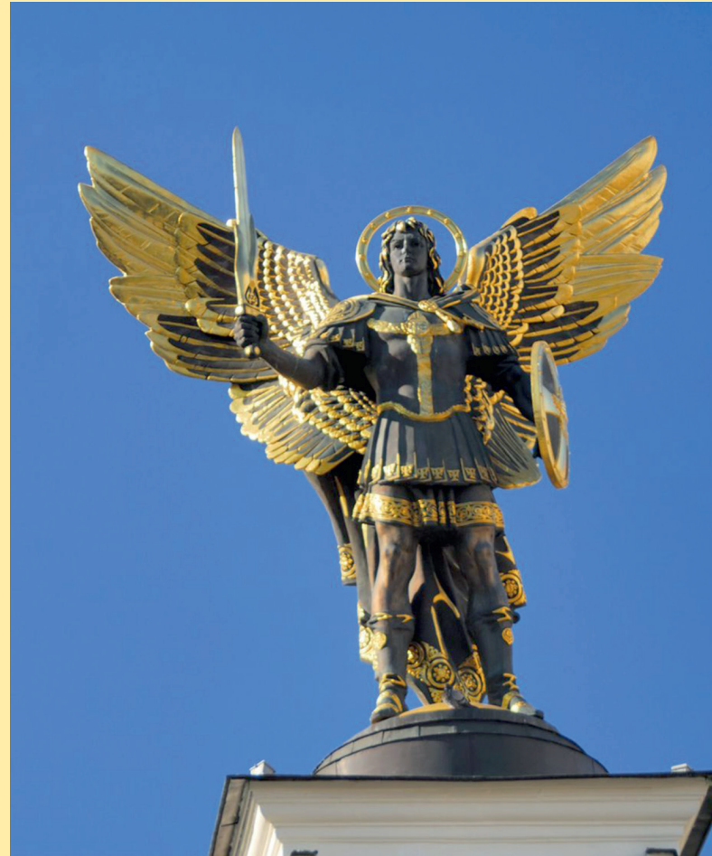
Ärkeängeln S:t Mikael, Maydan nezalejnosti; Kiew/Ukraine

Helige Mikael, ärkeängel, försvara oss i drabbningen, var vårt värn emot djävulens skurkstreck och snaror. Må Gud befalla över honom, bönfaller vi ödmjukt; och du, de himmelska härskarornas furste, fördriv i Guds kraft till helvetet, satan och alla andra onda andar, vilka till själarnas fördärv stryka omkring överallt i världen. Amen.